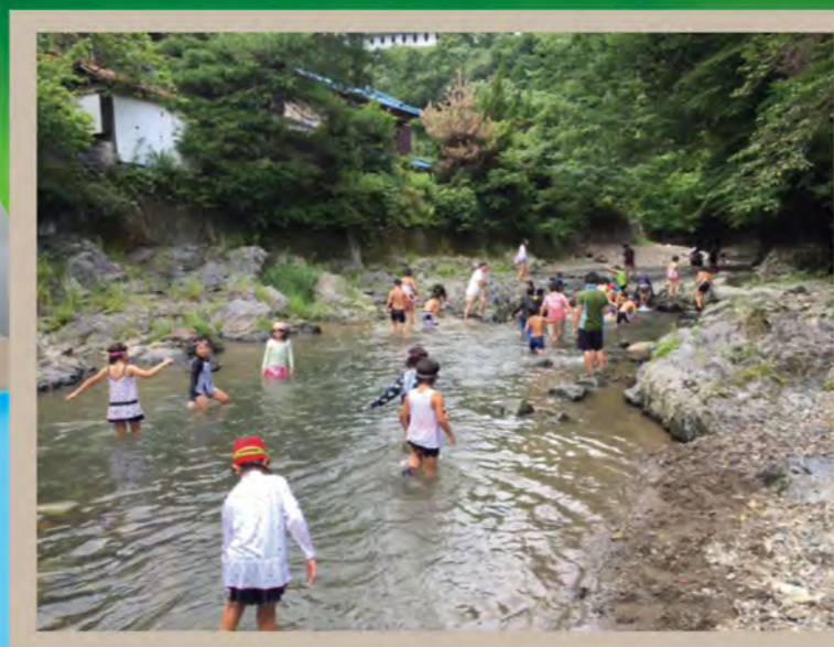
NPO法人ノート (高槻市青少年教育団体)