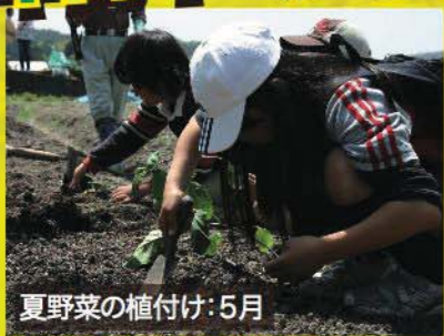
夏野菜の植付け:5月