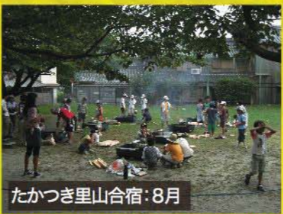
たかつき里山合宿:8月

もぎたて夏野菜でバーベキューだぁ！ 大人気★芥川での川遊び。 原地区のお米で作ったおにぎりは おいしいよ♪