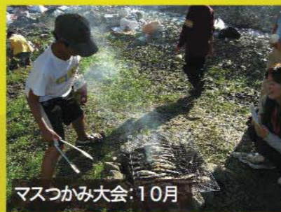
マスつかみ大会:10月

とっただお〜★芥川でマスつかみ！ 川原で焼いて食べました！イモ掘り大会 &焼きいも作りも実施。